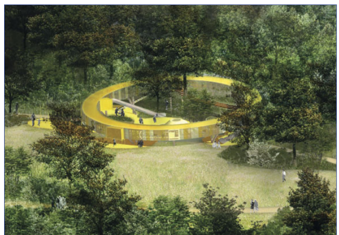
Espace de jeux. Visuel non contractuel.