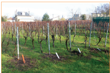
Le second clos des vignes de Sucy.