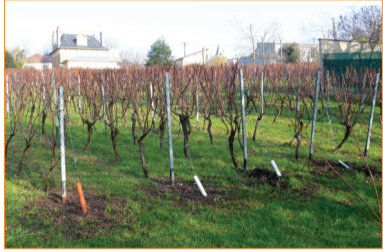
Le second clos des vignes de Sucy.