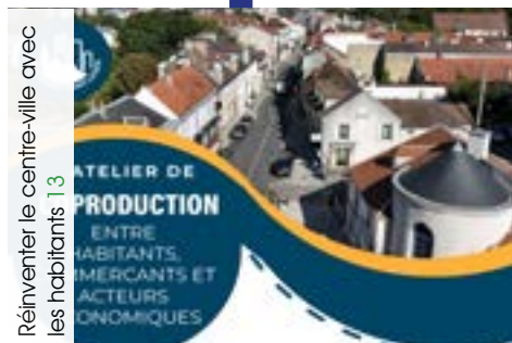
Réinventer le centre-ville avec les habitants 13