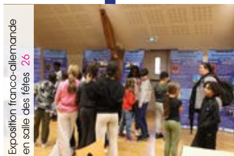
Exposition franco-allemande en salle des fêtes 26