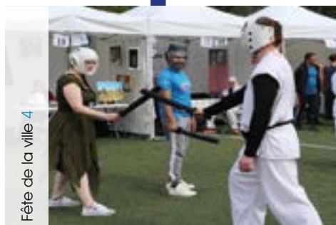
Fête de la ville 4