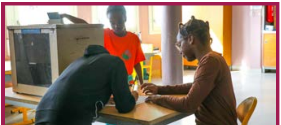
Les élections à l'école Jacques-Prévert : les électeurs suivent scrupuleusement le déroulement du vote

La séance plénière d'ouverture devrait avoir lieu la deuxième semaine de novembre, en mairie, salle des mariages.