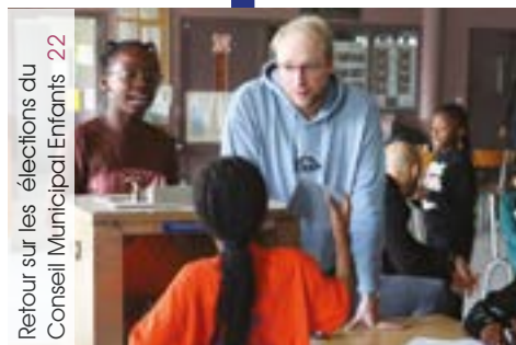
Retour sur les élections du Conseil Municipal Enfants 22