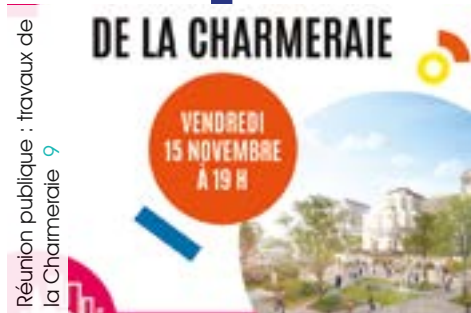
Réunion publique : travaux de la Charmeraiie 9