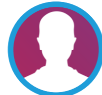
Recrutement en cours Informatique