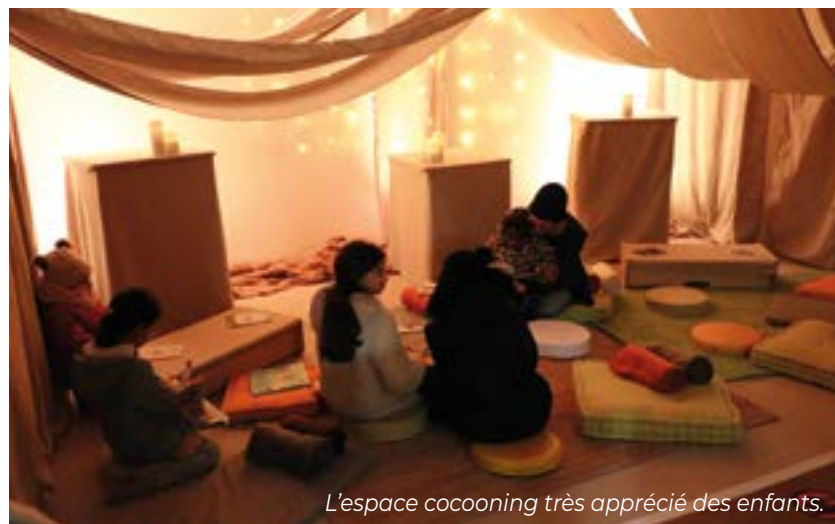
L'espace cocooning très apprécié des enfants.