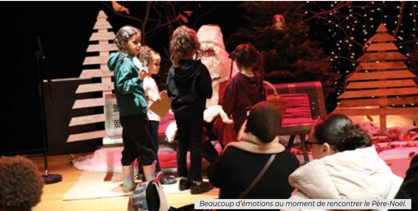
Beaucoup d'émotions au moment de rencontrer le Père-Noël.