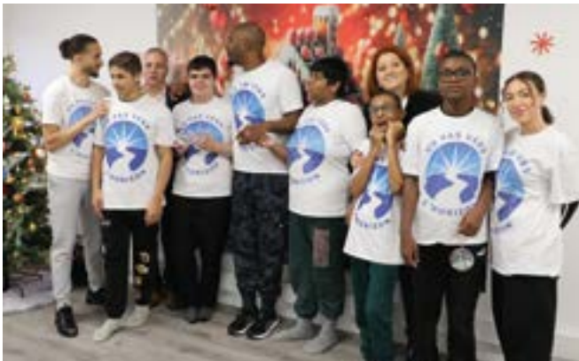
26 > Un pas vers l'horizon, pour la prise en charge de jeunes autistes