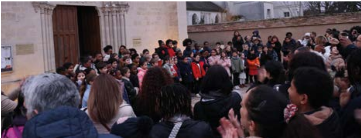
14 > Inauguration du parvis de l'église Saint Léger