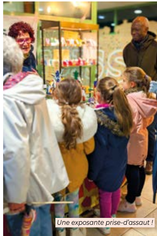
Une exposante prise-d'assaut !