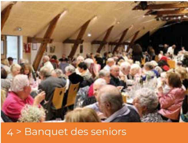
4 > Banquet des seniors