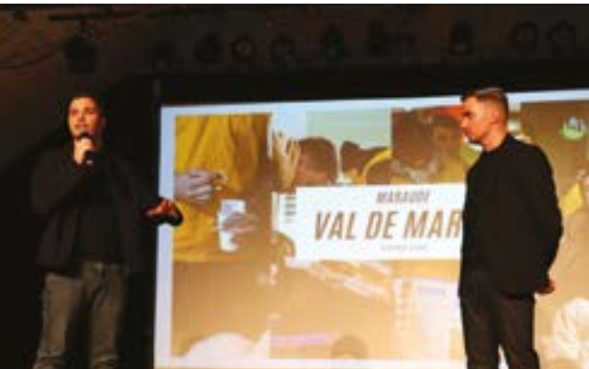
25 > Soirée de la réussite