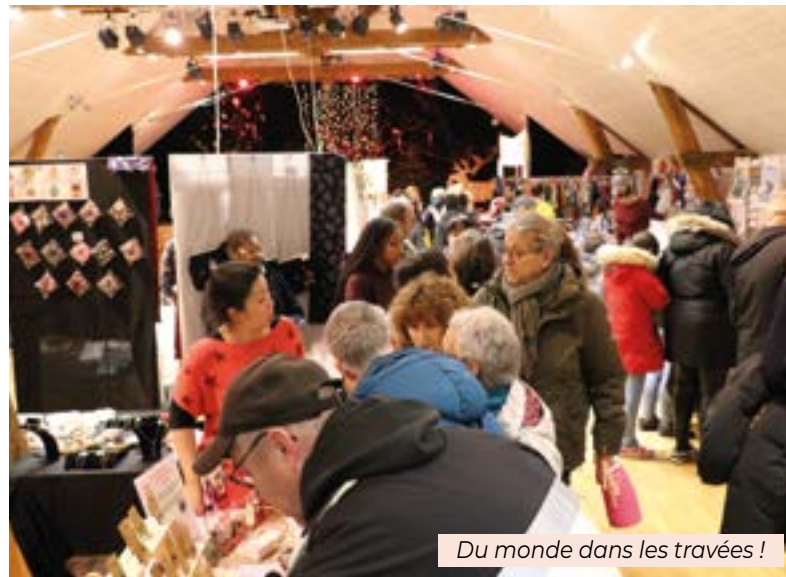
Du monde dans les travées !