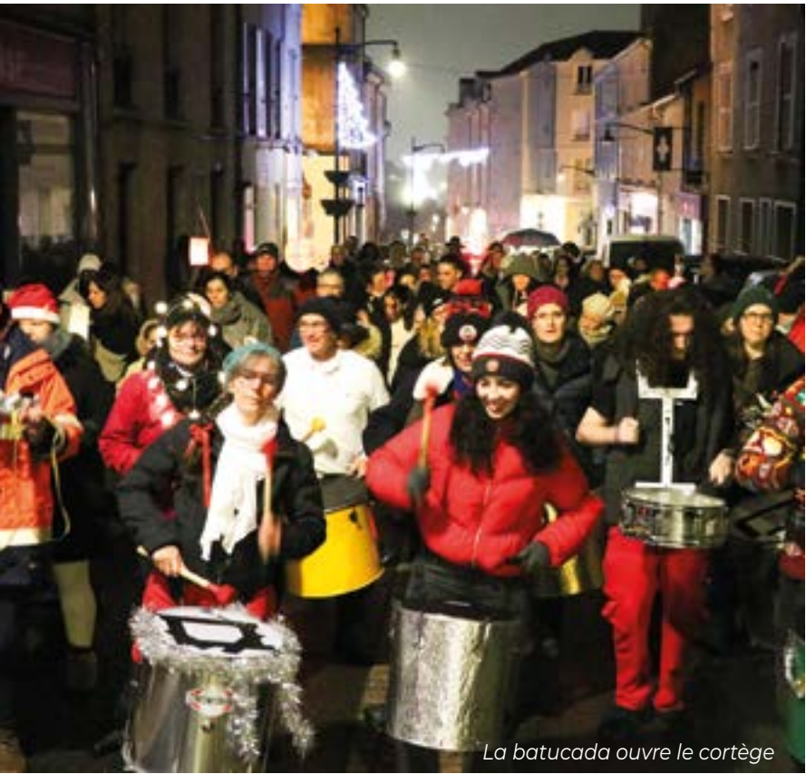
La batucada ouvre le cortège

Grosse affluence au marché de Noël qui s'est déroulé sur 3 jours, le dernier week-end de novembre.