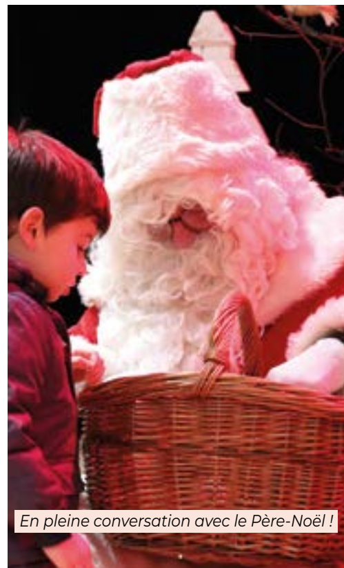
En pleine conversation avec le Père-Noël !