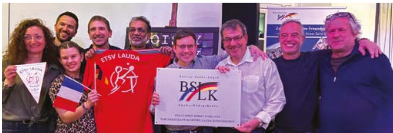
18 > Vingt-cinq ans de jumelage entre Boissy et Lauda