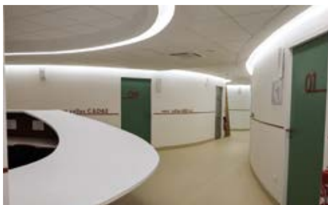
19 > Ouverture de la maison de santé