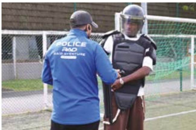
4 > Village citoyen