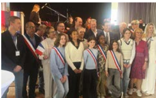
22 > Les délégations du CME et CMJ à Lauda